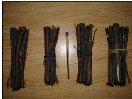
شکل ۴: نمونه ریشه‌های دسته‌بندی شده

مطالعات انجام شده نشان می‌دهد که خواص مکانیکی ریشه تابع گونه گیاهی و شرایط محیطی است. به همین دلایل موفقیت استفاده از روش‌های زیستی مهندسی در پایداری شیب‌ها به شرایط محیطی منطقه بستگی دارد. هر چند می‌توان بعضی از ویژگی‌های فنی و مهندسی گونه‌های گیاهی را به طور کلی مشابه دانست اما برخی خواص آنها از منطقه‌ای به منطقه‌ای دیگر متفاوت است و برای کسب داده‌های دقیق‌تر باید تحقیقات محلی انجام شود. از طرفی ایجاد پوشش‌های گیاهی در مکان‌های آزمایشگاهی و کنترل شده، زمان‌بر و پرهزینه است. بنابراین استفاده از رویشگاه‌های طبیعی یکی از راهکارهای پیشنهادی جهت انجام تحقیقات زیست مهندسی خاک می‌باشد. در انتخاب مکان تحقیق باید به موارد زیر توجه نمود: