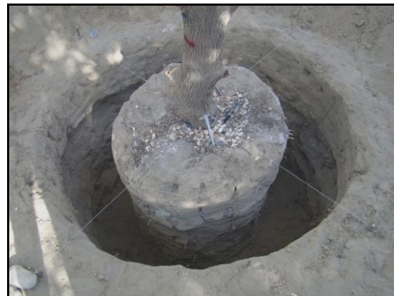
شکل ۳: روش مقطع پروفیل دایره‌ای

پژوهش‌های زیست مهندسی خاک به شکل میدانی ممکن است به روش‌های مختلف انجام شود. که از جمله آنها می‌توان به روش آزمایش برش مستقیم درجا، آزمایش بیرون کشیدگی ریشه و آزمایش مقاومت کششی ریشه و استفاده از مدل و ۱۲ اشاره نمود [۱۵]. از آنجایی که استفاده از روش‌های زیست مهندسی خاک برای اهداف فنی و مهندسی رو به گسترش است در این مطالعه مشکلات اجرایی این‌گونه طرح‌ها مورد بررسی قرار می‌گیرد.