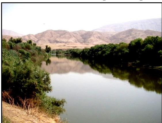
شکل ۱: مکان انجام مطالعه - رودخانه سیمره - شهرستان دره‌شهر

در شکل‌های (۱)، (۲) و (۳) نشان داده شده است. همزمان با حفاری و بررسی سیستم ریشه، نمونه‌های ریشه برای آزمون کشش به تفکیک چهار ربع انتخاب شد (شکل-۴). نمونه برداری از ریشه در فصل پاییز انجام گرفت. ریشه‌ها را در طول‌های ۲۰ سانتی‌متری برش داده و تا زمان انجام آزمون کشش در محلول ۱۵ درصد الکل نگهداری شدند [۱۱، ۱۲ و ۱۳]. مقاومت کششی نمونه ریشه‌ها یک ماه بعد از برداشت تعیین گردید. برای اندازه‌گیری مقاومت کششی ریشه‌ها از دستگاه کشش اینسترون-۴۴۸۶ ۱۱ دانشگاه تهران استفاده شد (شکل-۵). قبل از انجام آزمایش، قطر ریشه در سه نقطه از طول (ابتدا، وسط و انتها) اندازه‌گیری و از متوسط حسابی آن برای محاسبه سطح مقطع استفاده شد. حداکثر نیرو اعمال شده به ریشه در لحظه گسیخته شدن یادداشت گردید. مساحت سطح مقطع با متوسط قطرهای اندازه‌گیری شده محاسبه شد. از تقسیم حداکثر نیرو بر سطح مقطع ریشه مقاومت کششی ریشه محاسبه شد. سرعت اعمال نیروی وارد به ریشه، بر مقاومت کششی ریشه موثر است و با افزایش سرعت، مقاومت کششی ریشه افزایش می‌یابد [۱۴]. برای مطالعه هر یک از موارد ذکر شده پژوهشی زیست-مهندسی در عمل مشکلاتی وجود دارد که شناخت و بررسی آن‌ها سبب افزایش دقت در برداشت داده‌ها، کاهش هزینه‌ها و صرف‌جویی در زمان می‌شود. در این مطالعه هر یک از مشکلات پیش‌روی پژوهش‌های زیست مهندسی خاک بررسی و به تفصیل بیان شده است.