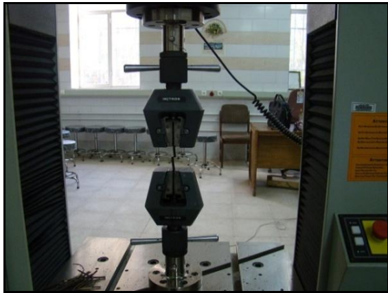
شکل ۵: نمونه آزمایش کشش موفق