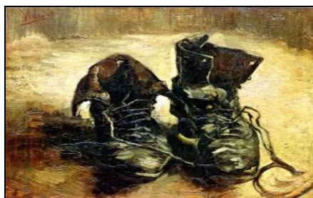
تصویر ۱، وین سنت ون گوک یک جفت کفش (1886).

نمی‌نهد مانند جنس و رنگ کفش، بلکه آن‌ها را مستقیم وصف می‌کند. در واقع هدف او این است که نگرستن به کفش‌ها را از طریق نقاشی آسان کند. به همین جهت هایدگر می‌گوید: هر چه زن کشاورز کمتر به کفش خود بیندیشد و یا به آن نگاه کند و یا حتی فقط آن را حس کند، بیشتر کفش، کفش است. چرا که زمانی به کفش (به عنوان ابزار) نگاه می‌کنیم که کارایی خود را از دست داده و عیب و نقصی پیدا کرده است.