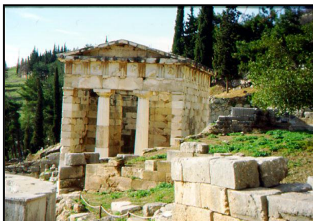
تصویر ۲، معبد پستوم، یونان، مأخذ: www.farm4.static.flicker.com

رویکرد پدیدارشناسانه هایدگر اقتضا می‌کند که برای فهم کار هنری به سراغ خود کار هنری برویم؛ لذا اگر بخواهیم هنر معماری را بفهمیم باید سراغ آثار معماری را بگیریم. هایدگر یک معبد یونانی (تصویر ۲) را به عنوان کار هنری واگشایی می‌کند. او در مقاله سرآغاز کار هنری نحوه «گردآوری» کار هنری را و اینکه چگونه محیط پیرامون در آن حاضر می‌شود، شرح می‌دهد. معبد یونانی به عنوان مثال آورده می‌شود. هایدگر چنین می‌گوید: «پرستشگاه [یونانی] گنجاننده صورت خداست و آن را می‌گذارد تا پوشیدگی چهره از میان تالار باز و پر ستون، در حریم و حوزه قدسی در ایستد. به واسطه معبد، خدا در معبد حضور دارد. اما معبد و حریم آن در نامتعیین ناپیدا نمی‌رود. معبد گرداگرد خود، رشته و سلسله نسبت‌هایی را سامان و وحدت می‌دهد که از آن‌ها «انسان» چهره حوالت خود را از زایش و مرگ، شکر و شکایت و ... نصیب می‌برد. گستره این نسبت‌های باز عبارت است از «عالم» این قوم تاریخی. در این عالم و از این عالم است که این قوم به خود باز می‌آید تا نقش خود را تمام ایفا کند. بنا ایستاده بر جا پایدار است به سنگ پی ... تابش و درخشش سنگ که خود جز از لطف خورشید نمی‌نماید، روشنی روز را به نمایش می‌آورد و گستردگی آسمان را و تاریکی شب را. برجستگی پایدار فضای نادیدنی هوا را دیدنی می‌سازد. (هایدگر، ۱۳۸۵ الف، ص ۲۰)