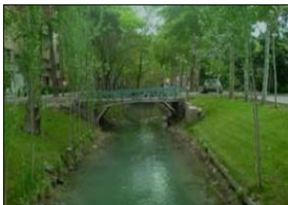
شکل ۴- نمونه‌ای از فضاهای شکل گرفته در اطراف مادی‌ها