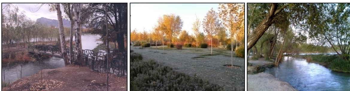
شکل ۲- نمونه‌ای از پارک‌ها و فضاهای سبز شکل گرفته در حاشیه زاینده‌رود و قابلیت استفاده آن‌ها به منظور کشاورزی شهری